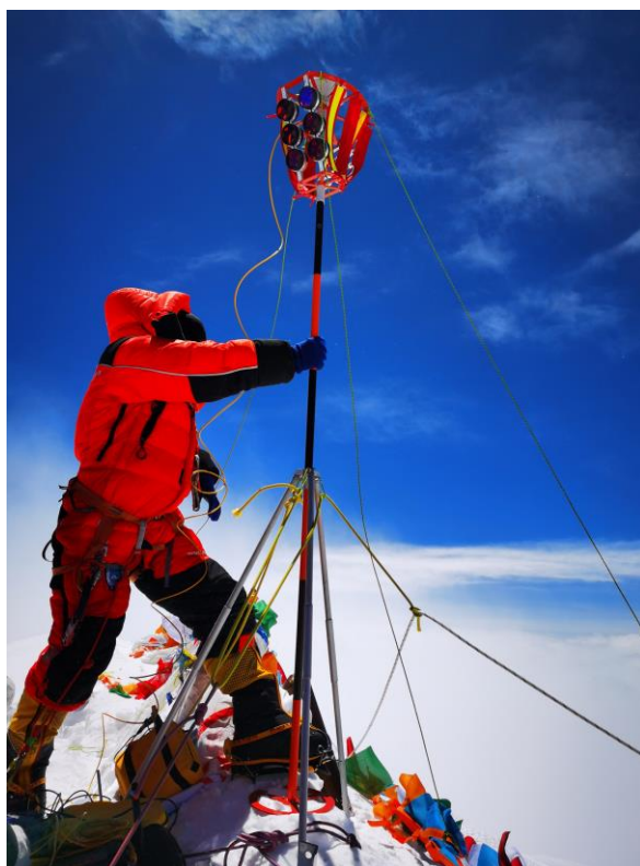
图：2020 珠峰高程测量登山队成功登顶图片