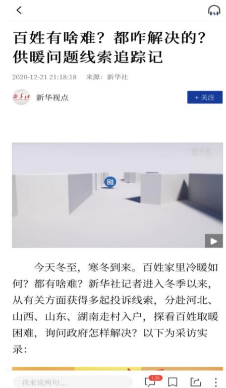
图：《民生直通车：百姓有啥难？都咋解决的？ ——供暖问题线索追踪记》报道截图

开设“民生直通车”等民生服务重点栏目，播发《供暖问题线索追踪记》《恼人的“奇葩证明”如今还有吗？》等报道，推动群众投诉多年的问题得到解决。围绕就业、医疗、教育、养老等民生领域问题，推出《“速冻”模式来袭，户外劳动者享受到“低温津贴”了吗？》《很多农民为此糊里糊涂背上二三十万元债务》《“每月靠房子能拿到数万元养老金”？老年人须提防以房养老理财骗局》等一批重点报道，回应民生关切，获得广泛好评。