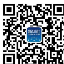
新华社 微信公众号二维码