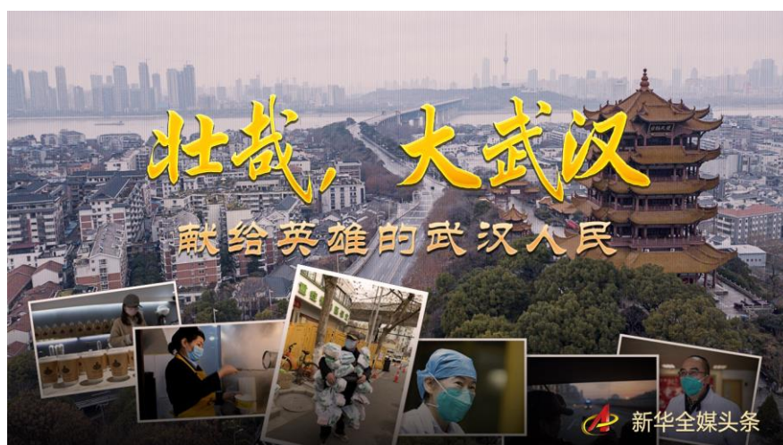
图：《壮哉，大武汉》全媒体报道截图

新冠肺炎疫情发生后，第一时间启动报道应急机制，在武汉设立前方报道指挥部，采写《壮哉，大武汉》《将战“疫”进行到底！》《英雄之城》等报道力作，推出《新华社记者直击湖北保卫战》《从“暂停”到“重启”：武汉解除离汉通道管控》等现场报道，单篇稿件最高被超过 8200 家媒体采用，极大鼓舞了士气、振奋了信心。加强经济形势经济政策宣传，围绕“六稳”“六保”等主题策划重点稿件，开设“中国经济新观察”“抓好经济发展 应对复杂局面”“聚焦复工复产”等栏目，播发各类报道 1 万余篇，大力宣传党中央对经济形势的分析判断和重大决策部署，充分展示经济社会发展的新成就新经验新亮点，有力提振信心、稳定预期。“新华时评”开辟热评、微评，推出《荒唐决策，岂是道歉可以了之》等多篇评论稿件，引起社会强烈反响。