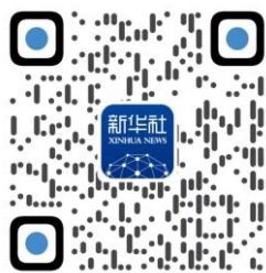
新华社客户端二维码