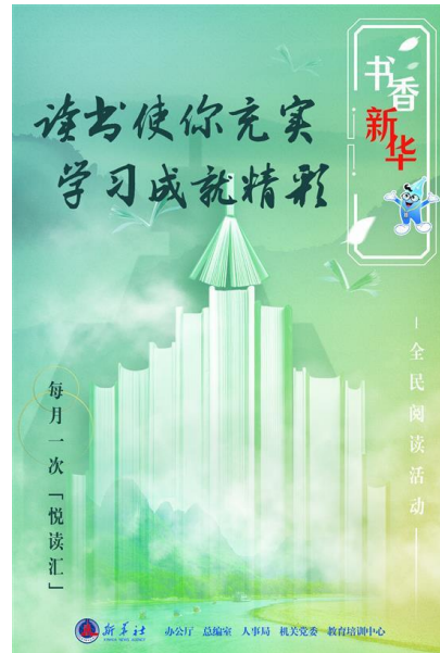
图：书香新华悦读汇海报