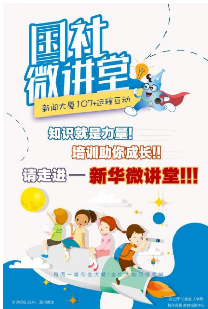
图：国社微讲堂海报