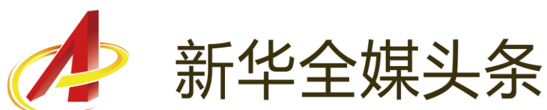
图：重点栏目“新华全媒头条”

点品牌栏目建设，全社报道资源力量进一步整合。参与县级融媒体中心建设，基本实现对已建成县级融媒体中心新闻供稿全覆盖。加快先进技术在新闻报道各环节全流程运用，国家重点实验室建设扎实推进，“媒体大脑”等技术与全媒体采编发平台实现联通，“现场云”入驻机构 4000 多家、日均直播近千场。