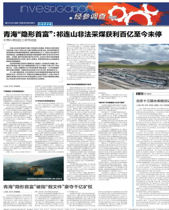
图：《青海“隐形首富”：祁连山非法采煤获利百亿至今未停》报道截图

围绕党和国家明令禁止、人民群众深恶痛绝的现象和问题，持续做好舆论监督报道，播发《青海“隐形首富”：祁连山非法采煤获利百亿至今未停》《偷捕现象未绝，“江鲜”仍在高价交易——长江“禁渔令”实施近半年追踪》等独家报道，有力抨击时弊、抑恶扬善，推动改进工作、解决问题。