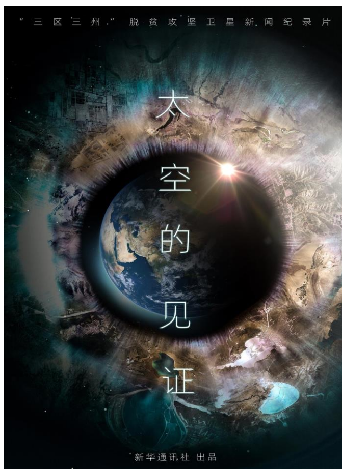
图：卫星新闻产品《太空的见证》海报

不断强化融合产品创新，党的十九届五中全会重点报道“@致我们终将值得的青春”全网总浏览量超过4亿，卫星新闻实验室、中国策工作室、“中国Vlog”等项目持续推出重磅作品，打造中国首部卫星新闻纪录片《太空的见证》。探索“揭榜挂帅”业务创新和创意征集机制，推出系列浏览量过亿的产品，其中“寻找那些似曾相识的面容”系列融合报道及网络互动活动总浏览量达2.5亿。