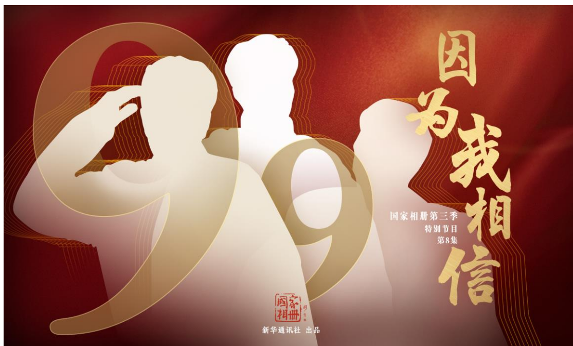
图：《因为我相信》产品海报

决战决胜脱贫攻坚等，推出《因为我相信》等一批融媒体重磅产品，在潜移默化中弘扬清风正气，营造良好舆论氛围。