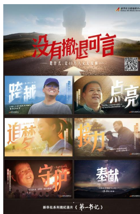
图：系列微纪录片《第一书记》截图 (来源：新华社，2020 年 10 月至 11 月)

圆满完成党的十九届五中全会、全国两会、深圳特区建立 40 周年、第三届中国国际进口博览会等重大战役性报道，播发《历史性的跨越 决定性的成就》《创造新时代中国特色社会主义的更大奇迹》等重大成就报道，营造了正面舆论强势。精心组织“决胜全面小康、决战脱贫攻坚”重大主题宣传，推出《第一书记》《决战决胜夺取脱贫攻坚战全面胜利》等重点报道，为脱贫攻坚提供有力舆论支持。创新主题报道，播发“回眸‘十三五’”“青春梦想 青春奋斗”等系列报道，“五中全会精神在基层”专栏推出《赢向未来》等一批短、实、新报道，得到广泛好评。